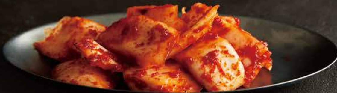
自家製シャキシャキ 白菜キムチ