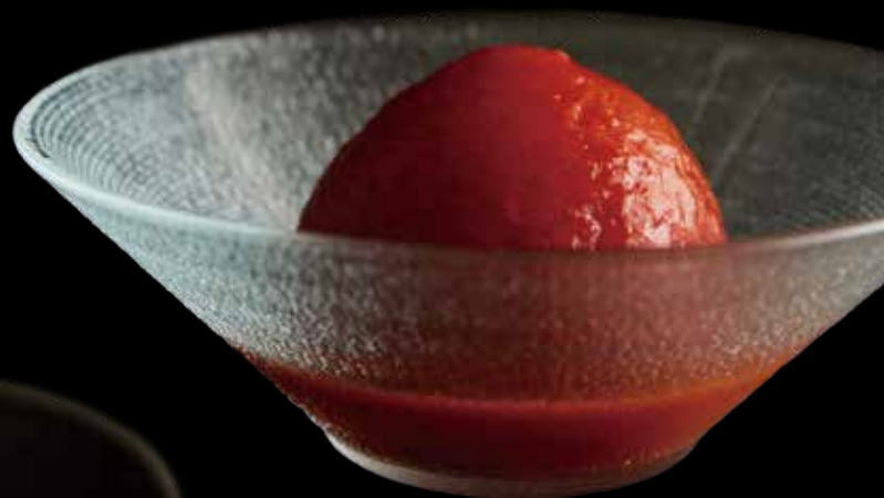
真紅のトマト コチュジャンソース