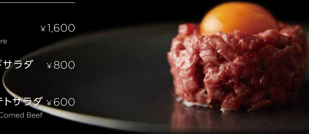
但馬 "太田牛"の ユッケ